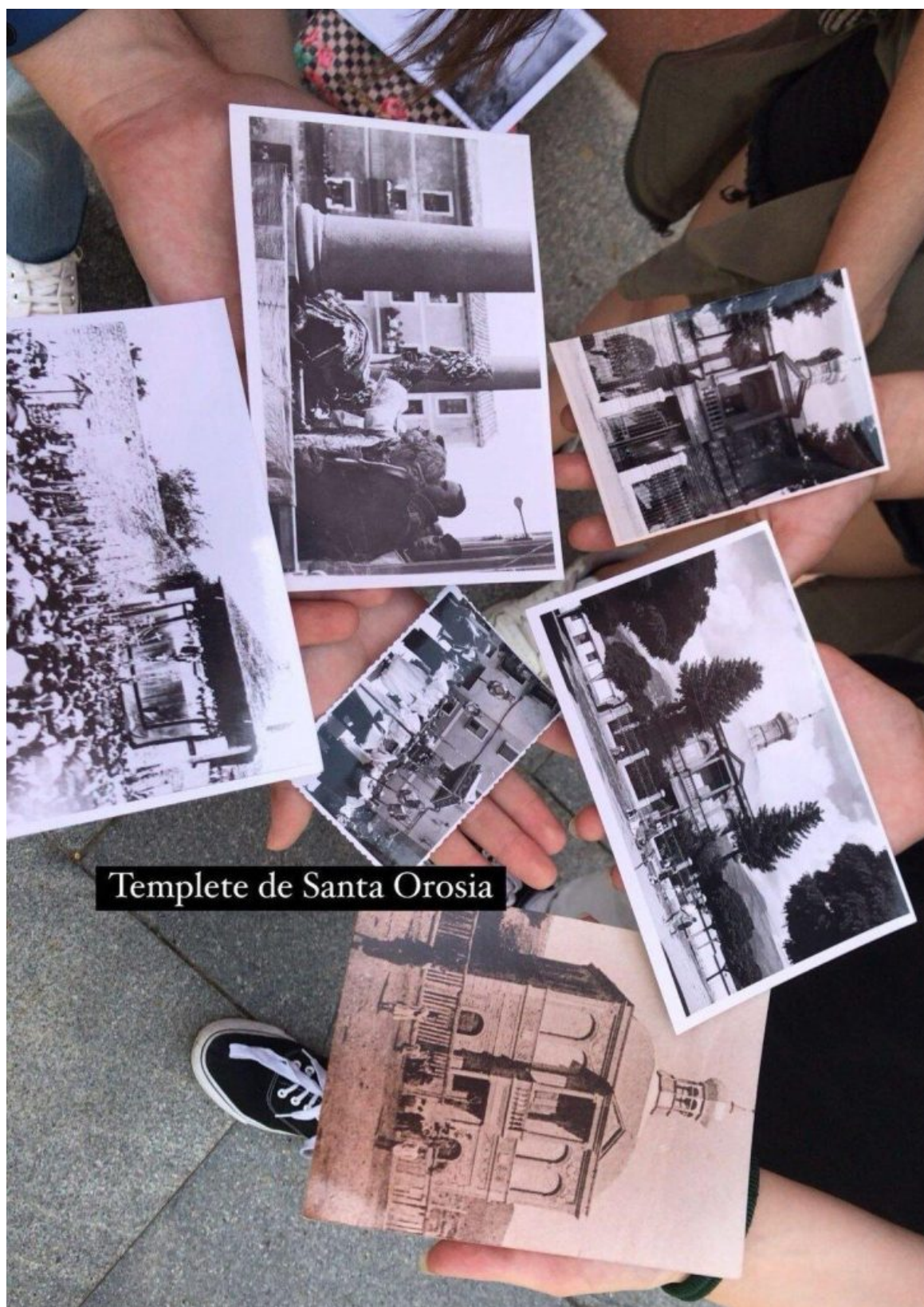
Templo de Santa Orosia