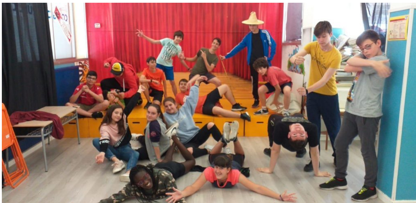
Calendario y difusión.