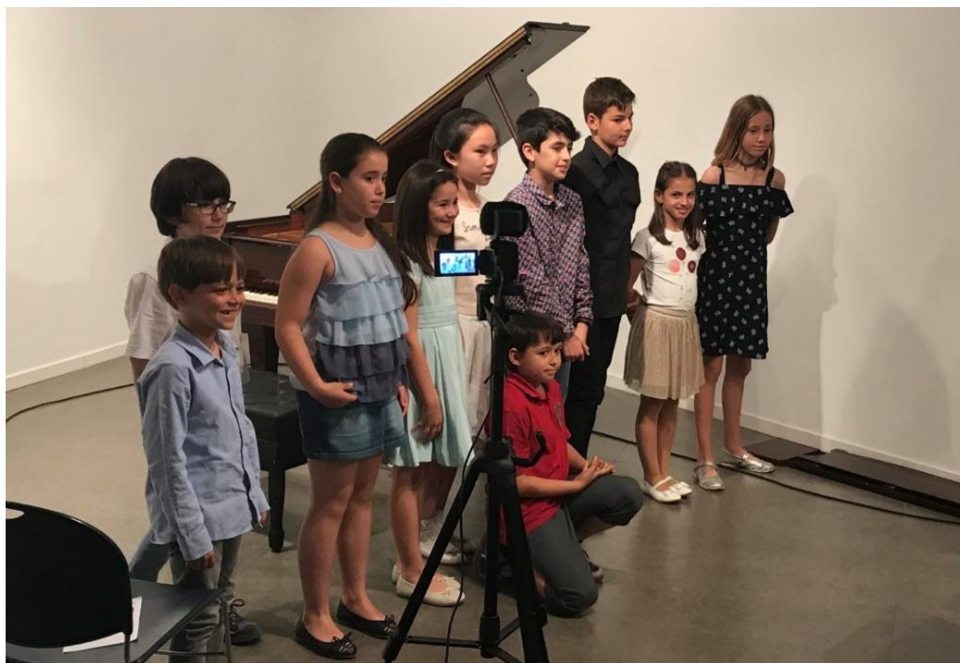
Saludo de los intérpretes al final del concierto